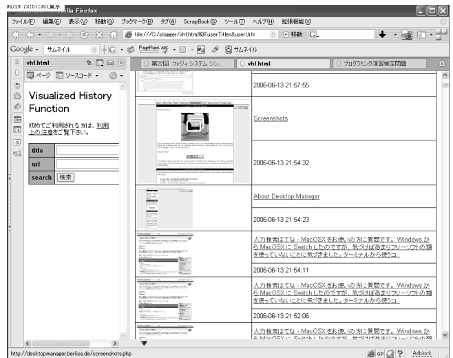
図 5: サムネイル付の履歴機能

閲覧履歴の XML ファイルを XSL によって変換し、CSS ファイルを用いて出力する項目とレイアウトを決めている。画面上の URL またはサムネイルをクリックすることにより、該当のページを開くことができる。