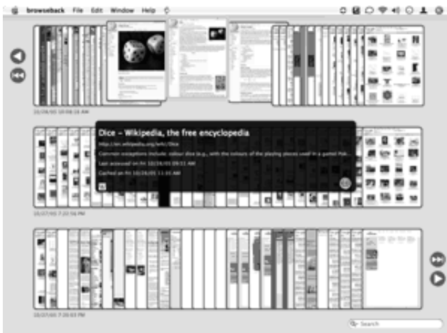
図 2: browseback の履歴機能

履歴情報ではないが、Google の検索結果のページをサムネイルとして表示する GooglePreview も公開されている。[11] この Extension では、thumbshots.org や alexa.com によって公開されているサムネイル情報を用いて実装されている。そのため、イントラネット上の Web ページなどはサムネイル情報が表示されないという問題がある。