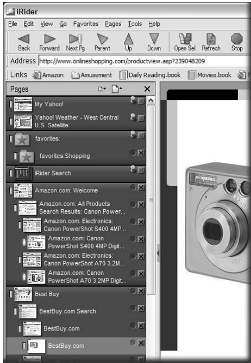
図 1: iRider の履歴機能

てオープンソースである、クロスプラットフォームの実現している、非常に優れた拡張性を持つ、がある。ブラウザの仕組みは以下の図 3 のような構成をしている。